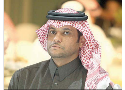
إمادة على شرف اتحادات الرياضة بقطر